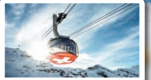
TITLIS ROTAIR First revolving cable car